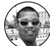
लेखक: अनिल कर्क ठेगाना: जनकपुरधाम उपमहानगरपालिका-५, (बेल्ही टोल)

तिमीले देश बनाउँछौ भन्थौ, म दुक्क थिएँ। तिमीले देश बनाउँछौ भन्थौ, म दुक्क थिएँ। तर एकाएक, तिमी बोलीको प्रतिध्वनि पनि नमेटिँदै, आफ्नै आमाको अस्मितामाथि आँला उठायो। माटो छोएर कसम खायो, तर त्यही माटोमाथि प्रश्न गर्न थाल्यौ। आमाको महिमा गाउँदै हिँड्यौ, तर सन्तान हुनुको कर्तव्य बिसर्प्यौ। कोखको माया बिसर्प्यौ। त्यसैले आज, म दुक्क छैन। त्यसैले आज, म दुक्क छैन। मेरो मन, देशको चिन्ताले दुक्कदुक् गरिरहेको छ। स्वार्थले प्रेरित भएपछि, सायद धेरै कुरा बिसर्न सकौला। स्वार्थले प्रेरित भएपछि, सायद धेरै कुरा बिसर्न सकौला। तर नबिर्स तिमीमाथि असीम भरोसा बोकेर मतको भारी बिसाउने जनतालाई। जनता उभिएको माटोलाई। तिमीलाई आशीर्वाद दिने ती बाआमालाई नबिर्स। यसरी बिसर्ने शिलशिला बढ्दै गयो भने, यसरी बिसर्ने शिलशिला बढ्दै गयो भने, एक दिन तिमीले देशलाई नै बिसर्न सक्छौ। तर जुन दिन देशलाई बिसर्नेछौ, त्यो दिन भन तिमी कसको शासक बनेछौ? कसको नेतृत्व गर्नेछौ? धन्यवादा जय नेपाल